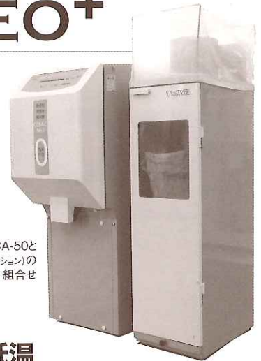
CA-50と ヌカラックA(オプション)の 組合せ

差別化をめざす米穀店、直売店、飲食店、販売農家のみなさんに おすすめ。コメックネオの採用で、他店にない魅力づくりを!